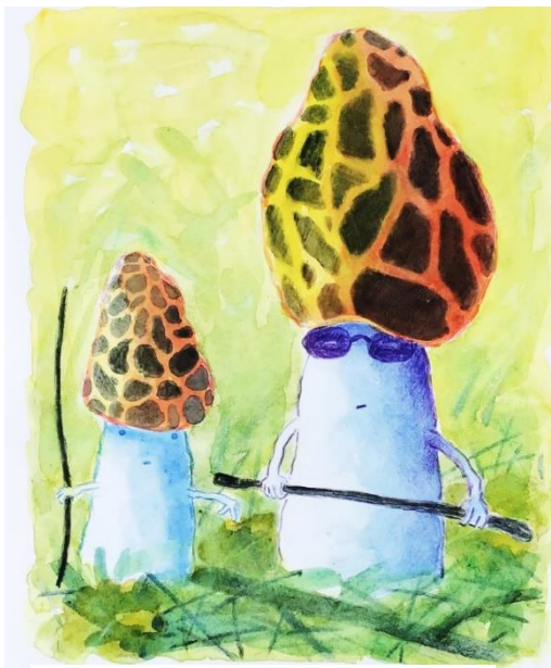
Figur 4 Hans Chr. Røds ventyrsvamp

I et kakofonisk virvar af beskeder og uforståelige tegn forbindes livet i sejren over tiden: