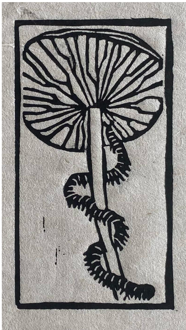
Figur 3 Sofie Ditlevs eventyrsvamp

Udstillingen med de to fynske fuglemalere kan ses til 30. juni.