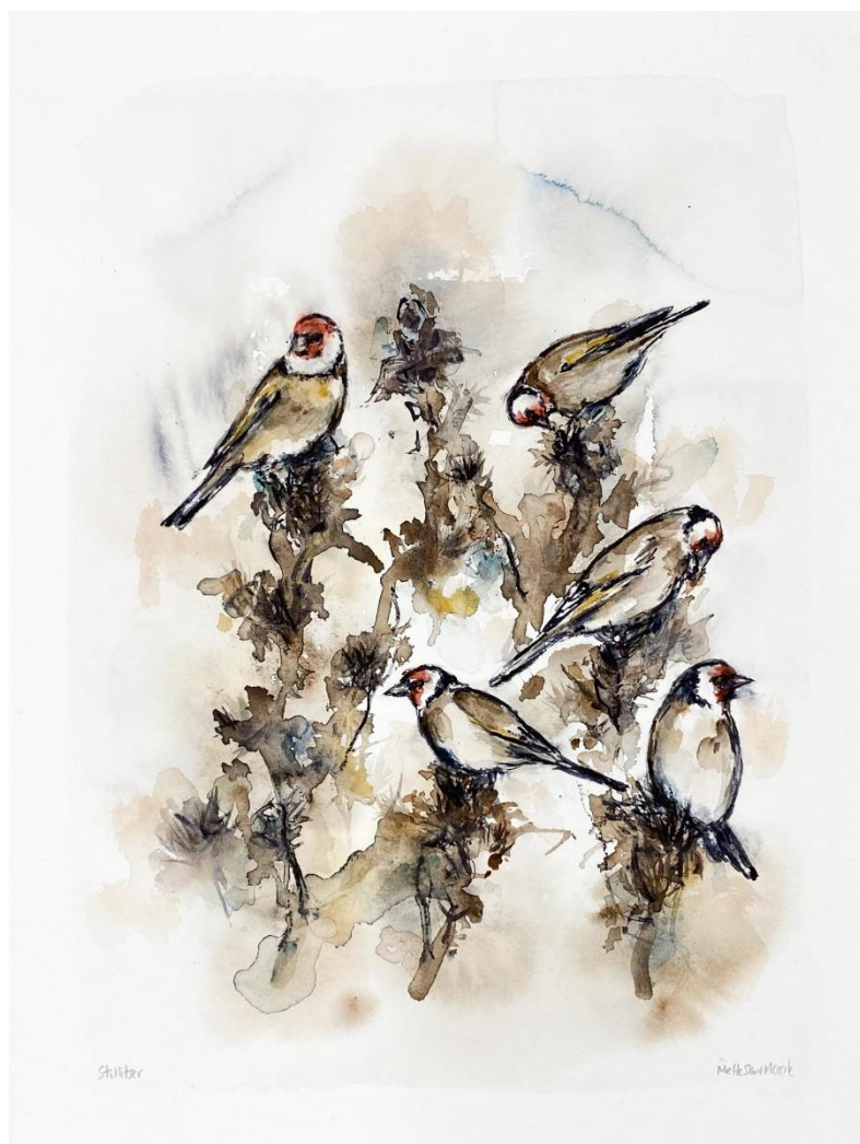
Figur 3 Mette Skov Mærsk: Stillitser